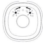
Activation du mode Sommeil

Pour activer le mode Sommeil, il suffit de maintenir appuyé le bouton central pendant plus d'une seconde, jusqu'à ce que les leds s'allument de l'extérieur vers le milieu. Appuyez une nouvelle fois sur le bouton alors que les leds continuent à s'allumer de chaque côté vers le milieu. Toutes les leds s'allumeront en même temps 2 fois successivement pour confirmer que vous êtes bien entré dans le mode sommeil.