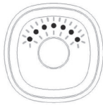
Mode Sommeil Activé

Pendant le mode sommeil, il n'est pas possible de consulter l'évolution de la mesure de votre objectif sur le capteur. En effet, dans le mode Sommeil, votre Coach ne mesure que les mouvements correspondant à vos phases de sommeil. Si vous appuyez une fois sur le bouton, les leds s'allumeront des côtés vers le milieu pour vous indiquer que vous êtes dans le mode Sommeil.